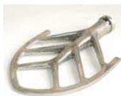
M043-R101 PALETTA DI MISCELAZIONE Costruita in acciaio inox.